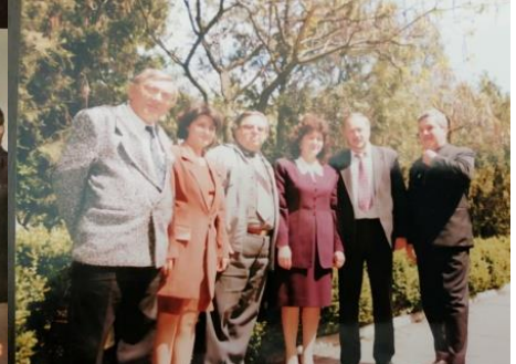
та «Dunărea de Jos» (1994)

Вагомими культурними здобутками позначилася діяльність пошукового історико-етнографічного клубу учнів і молоді «Істрос», заснованого відомим краєзнавцем, громадським діячем Валеіу Кожокару (1957-2010), директором історико-краєзнавчого музею м. Рені. Археолог, історик, письменник і педагог за фахом він зумів згуртувати навколо себе молодь, яка на волонтерських началах брала участь в археологічних розкопках на берегах озер Кагул і Ялпуг, багатих на дивовижні знахідки з минулого. Ряд артефактів з городищ Картал і Сату Ноу (старовинних монет, прикрас, керамічних виробів), віднайдених ентузіастами клубу