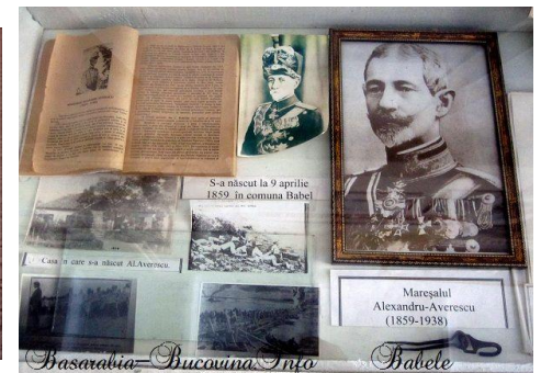
Фотографії з музею О. Авереску в с. Бабеле

Він також сприяв відкриттю румунського відділення в Ізмаїльському державному університеті, облаштуванню кабінету румунської мови та літератури в ІДГУ, наповненню бібліотечних фондів, організації стажування в Румунії викладачів і студентів; зіграв важливу роль в організації перших душевних та емоційних зустрічей румунської спільноти Буджака з однодумцями й перші після падіння «залізної завіси» поїздки в Румунію. У 1994 р. заклав основу дружніх стосунків між лідерами румунської спільноти та громадською організацією «М. Когелнічану» асоціації «Астра» (м. Ясси, голова Арета Мошу), яка вже 25 років продовжує співпрацювати з громадськими організаціями Бессарабії та Ізмаїльським державним гуманітарним університетом.