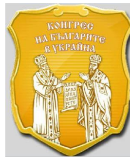
Емблема одеської громадської організації «Конгрес болгар України» (Одеса, 2007)