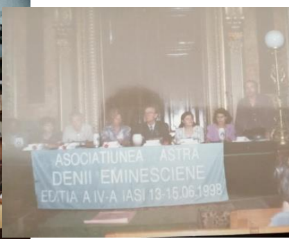
Асоціація ASTRA – Denii Eminesciencе, Яссу (1998)