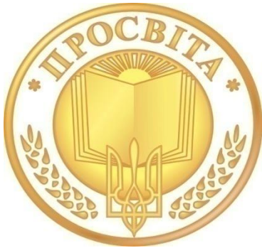
Емблема Всеукраїнського товариства «Просвіта» імені Тараса Шевченка

Ізмаїльська міська первинна організація Всеукраїнського товариства «Просвіта» імені Тараса Шевченка є відділенням найдавнішої проукраїнської громадської організації – товариства «Просвіта» (1868-1939), яке поновило свою діяльність з 1989 р., розпочавши нову сторінку громадської активності в історії українського державотворення. Метою громадської організації з часів заснування та відродження є