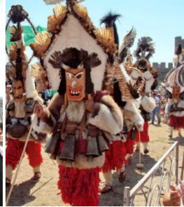
Шоу кукерів на Соборі болгар України (м. Білгород-Дністровський, 2018)