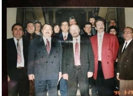
про співробітництво між ІДГУ