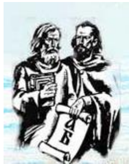
Емблема болгарської громадської організації «Кирила і Мефодія» (Болград, 1989)