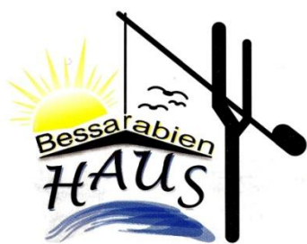
Емблема тарутинської громадської організації «Бессарабський дім»

та самотнім мешканцям німецького походження. При організації працює хорівий, вокально-інструментальний, танцювальний та фольклорний гуртки, організується літній відпочинок для дітей та інвалідів у оздоровчих дитячих таборах та санаторіях для осіб літнього віку. Члени общини відмічають національно-релігійні свята (Різдво, Пасха, День врожаю, День пам'яті тощо), влаштовують концерти колективів самодіяльності з виконанням національних пісень і танців. Активістами підготовлено цикл телепередач про видатних діячів Одещини німецького походження, читаються публічні лекції про внесок німецьких колоністів в розбудову Одеської області, розроблено екскурсійні програми «німецька Одеса», ведеться плідна співпраця з науково-освітніми центрами та благодійними фондами Германії, запущено інтернет-ресурс «Портал німців України» [10].