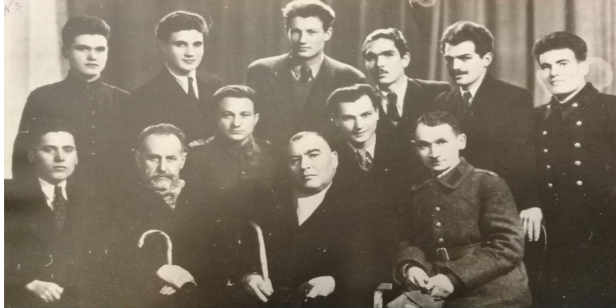
Союз бессарабських болгар, 1944, Софія (архів Істрико-краєзнавчого музею с. Городне- Чійший Болградського району Одеської області)