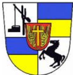
Bessarabiendeutscher Verein e.V.

Емблема громадської організації «Асоціація бессарабських німців» (м. Штудгард, Германія)