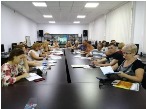
Курси румунської мови, культури та цивілізації у ІЦР

Результатом плідної діяльності Центру стала реалізація низки важливих проектів, серед яких «Розширення та просування румунської мови в румунсько-українському транскордонні просторі. Курс румунської мови для початківців» (2017); «Організація та функціонування Інформаційного центру Румунії в місті» (2018, 2019) в рамках договору на надання грантового фінансування від Міністерства румун звідусіль (Румунія). Інтерес до вивчення румунської мови в регіоні демонструє стійку динаміку: з 2017 по 2020 р. заняття відвідували понад 300 дітей та дорослих осіб, отримуючи знання безкоштовно. Іншим помітним здобутком стало відкриття у партнерстві з Румунським інститутом культури недільної школи румунської мови для дітей м. Ізмаїл.