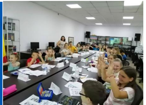
Школа румунської мови для дітей м. Ізмаїл

В рамках культурно-просвітницької діяльності Румунський інформаційний центр при ІДГУ співпрацює з державним департаментом румунів звідусіль, освітніми установами Румунії та України, місцевими та румунськими культурними організаціями. Починаючи з 2017 року, Румунський інформаційний центр ініціює та проводить низку освітніх та культурних заходів, що мають особливе значення для просування румунської мови, культури та цивілізації у регіоні. Започаткований з 2018 р. працівниками Центру Національний регіональний фестиваль «Парад юних талантів» об'єднує талановитих дітей, захоплених румунською народною й інструментальною музикою, народним танцем, театральними