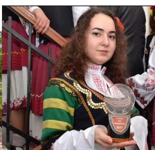
На церемонії вручення нагороди «Людина року» (Асоціація болгар України)