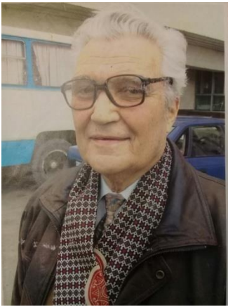
Болгарський активіст Петро Недов (1926– 2009)