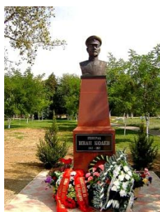
Пам'ятник генералу Івану Колєву (1864–1917), с. Банівка