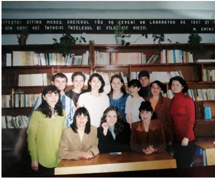
Кабінет румунської мови в ІДГУ, 1990-ті рр.