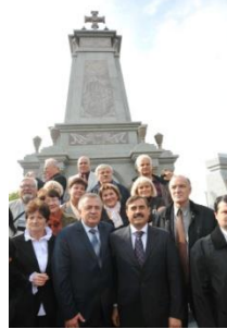
Пам'ятник болгарським ополченцям (Болград, 2012)