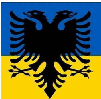
Емблема Ізмаїльської албанської громади «Обор Шиптар»