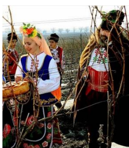
Свято «Трифон Зарезан» у с. Криничне Болградського р-ну (лютий, 2016)

болгаромовні родини. Як відомо, гімназія була заснована в 1858 р. на кошти молдавського державного діяча болгарського походження Нікола Богоріді (рум. Nicolae Vogoride, 1820–1863) у короткостроковий період приналежності регіону до Молдавського князівства (1858–1861). Цей навчальний заклад знаходиться під патронатом Міністерства освіти і науки України та Міністерства освіти і науки Республіки Болгарія, оскільки з початку свого заснування він був «кузнею кадрів» для національного визволення і державного будівництва Болгарії: майбутніх прем'єр-міністрів (Димитр Греков, Олександр Малинов), міністрів (Димитр Агура, Іван Салабашев, Георгі Згуров, Іов Титорів), академіка і першого ректора Софійського університету (Олександр Теодоров-Балан), генералів (Данаїл Ніколаєв, Георгі Тодоров) та інших видатних діячів науки, культури і політики (Драгомир Казаков, Іван Вулпе й ін.). В умовах частої зміни влади постійно змінювався статус і назви закладу: румунський ліцей (1876), російська восьмерична гімназія (1878–1884); державна російська гімназія імені імператора Олександра III (1884), румунський ліцей імені короля Кароля II (1918). У радянський період гімназія зі славним минулим була звичайною загальноосвітньою школою і нічим не відрізнялася від інших навчальних закладів районного значення, її історія і традиції були забуті.