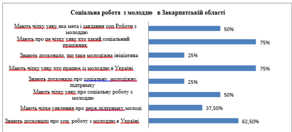
Діаграма 3.2. Результати анкетування «Соціальна робота з молоддю на державному рівні» в кінці дослідження

На першому етапі нашої тренінгової роботи «Специфіка соціальної роботи і підтримки сучасної молоді України» було встановлено, що учасники на початку роботи мають 100 % чітку уяву про підтримку молоді України на державному рівні; 50 % ознайомленні із загальними поняттями соціальної підтримки молодіжних ініціатив, однак 37,5 % зовсім не обізнані зі специфікою соціальної роботи з молоддю; 62,5 % учасників мають чітку уяву хто працює з молоддю в Україні; зовсім не обізнані, що таке соціальна робота і підтримка молоді на державному рівні (75 %) та хто такий соціальний працівник (62,5 %).