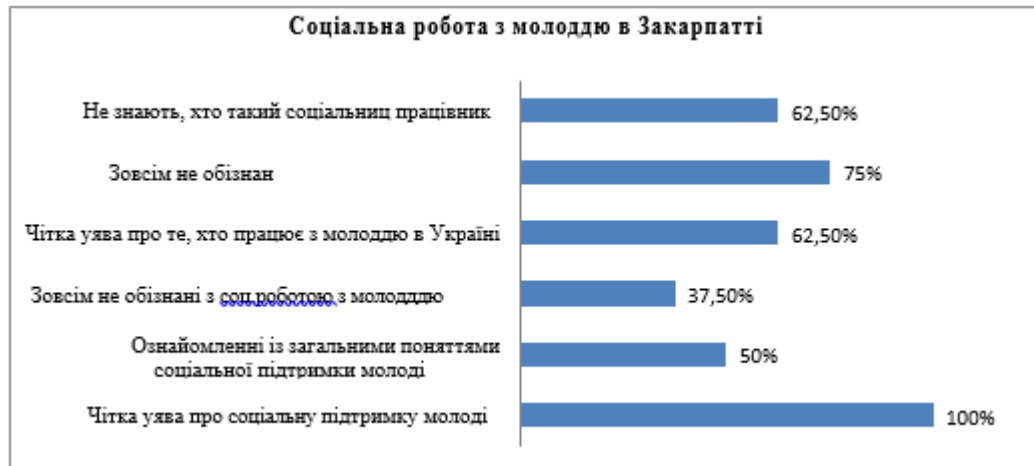
Діаграма 3.1. Результати анкетування «Соціальна робота з молоддю на державному рівні» на початку дослідження

На першому етапі нашої тренінгової роботи «Специфіка соціальної роботи і підтримки сучасної молоді України» було встановлено, що учасники на початку роботи мають 100 % чітку уяву про підтримку молоді України на державному рівні; 50 % ознайомленні із загальними поняттями соціальної підтримки молодіжних ініціатив, однак 37,5 % зовсім не обізнані зі специфікою соціальної роботи з молоддю; 62,5 % учасників мають чітку уяву хто працює з молоддю в Україні; зовсім не обізнані, що таке соціальна робота і підтримка молоді на державному рівні (75 %) та хто такий соціальний працівник (62,5 %).