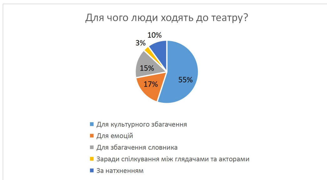
Рис. 3.1. Відповіді на питання «Для чого люди ходять до театру?»

Як бачимо з відповідей, більшість опитуваних не часто відвідують театр, мотивуючи це тим, що в нашому місті немає професійного театру, народний театр перестав давати вистави через війну, а професійні колективи до нашого міста майже не приїжджають. А ті, хто відповів «так», відвідують дитячі театральні вистави разом з дітьми.