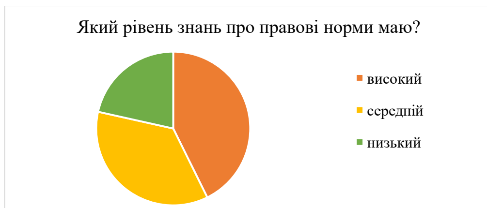
Рис. 2.2. Оцінка правових знань педагогічних працівників Матроського ЗЗСО

З опитування випливає, що лише 42,7% педагогів (6 осіб) вважають, що мають досить високий рівень знань про правові норми. Це може вказувати на необхідність подальшого навчання та підвищення правової грамотності серед педагогічного колективу.