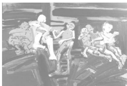
Йона Тукусер. Группы детей, № 1, 2013 (холст, масло, 90 x 130)

Детская смертность и высокая статистика по дистрофии стала одним из самых трагических последствий голодомора 1946-1947 гг. Эти тяжелые факты также стали сюжетами серии картин цикла «Голод».