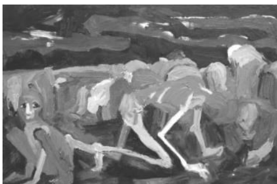
Йона Тукусер. Собирание урожая, 2010 (холст, масло, 90 x 130)

Символические образы картины «Собирание урожая» изображают людей, пытающихся из последних сил собрать остатки урожая в поле. Фигуры на переднем плане уже мало походят на людей: они находятся на границе между жизнью и смертью, выглядят как духи, существа из иного мира, их тела хрупки, им свойственны повадки животных. Йону потряс факт существования в СССР печально известного «закона о трех колосках», предполагавшего физическое уничтожение людей, собиравших остатки урожая с полей. Этот закон не останавливал людей от попыток укрыть от властей собственноручно выращенное зерно в надежде спасти себя от мук голода, поскольку результатом отказа от любого из этих вариантов была смерть. По признанию Йоны, ее бабушка по материнской линии была замечательной портнихой, платья которой дед возил на продажу в Галац, покупая на вырученные деньги зерно. Его доставка всякий раз сопровождалась сложностями, в частности, попыткой убийства со стороны односельчан с целью завладеть товаром. В старом доме и сейчас сохранился вырытый дедом в земле глубокий тайник для хранения зерна.