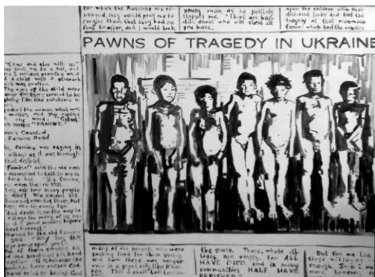
Йона Тукусер. Пешки трагедии в Украине, 2013 (холст, масло, 90 x 120)

трагедии в Украине». Сюжет картины «Нью-Йорк Таймс» возник под впечатлением факта о том, как первая англоязычная статья о голоде в Украине, написанная побывавшем в СССР журналисте Гарете Джонсе не была принята к публикации в ведущей американской газете «Нью-Йорк Таймс» и была напечатана в менее авторитетном издании. По замыслу автора, белый фон под газетной вырезкой, изображенный на этой картине, должен служить напоминанием об этом факте как оставшаяся пустой газетная колонка.