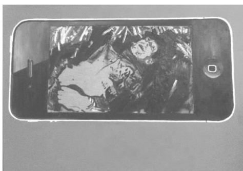
Йона Тукусер. Взгляд с XXI века на документ, № 1, 2013 (холст, масло, 90 x 120)

Серия картин цикла «Взгляд с XXI века на документ» нашла оригинальное авторское решение: реальные фотографии тех лет изображены сквозь призму экрана айфона, как если бы современный человек их мог запечатлеть, оказавшись случайным свидетелем страшных событий.