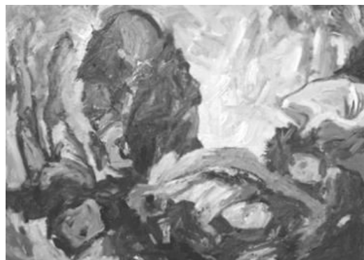
Йона Тукусер. Яма, 2010 (холст, масло, 90 x 120)

Первые картины цикла «Голод» Йоны Тукусер, по признанию автора, были созданы в процессе творческого поиска. Они отличаются повествовательностью, попыткой передать впечатления о голоде 1946-1947 годов средствами художественной абстракции, основанной на фактаже реальных событий. На картинах «Пейзаж» и «Яма» изображены брошенные друг на друга искривлённые тела, мертвые вперемежку с безнадежными и едва движущимися