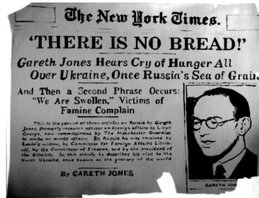
Йона Тукусер. Нью-Йорк Таймс, 2013 (холст, масло, 90 x 130)

Серия картин цикла «Взгляд с XXI века на документ» нашла оригинальное авторское решение: реальные фотографии тех лет изображены сквозь призму экрана айфона, как если бы современный человек их мог запечатлеть, оказавшись случайным свидетелем страшных событий.