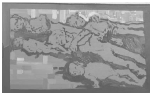
Йона Тукусер. Группы детей, № 2, 2013 (холст, масло, 90 x 130)

Общая высокая смертность населения привела к появлению новых сиротских приютов, один из которых изображен на картине «Детский дом». На ней представлена попытка передать сюжет одной из реальных фотографий тех лет, которая в художественном пространстве этой картины стоит на тумбочке перед кроватью персонажей. Тела девочек истощены, они нечесанные и неухоженные, но у одной из них есть силы играть с самодельной куклой, что символизирует наличие будущего у этого персонажа. Демонстративно обнаженная скелетоподобная фигура взрослого человека (которого нет на