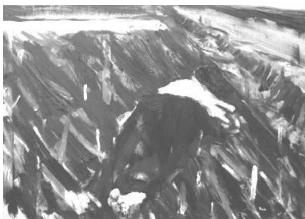
Йона Тукусер. Вечный сон, 2010 (холст, масло, 90 x 120)

Постепенно художница отходит от изображения абстрактных фигур в ярких цветовых пятнах, которые соответствуют и контрастируют со сложными тонами в их телах. На картине «Вечный сон» фигура лежащего на поле мертвого человека написана как абстракция, однако в ней присутствует отчетливо прорисованная реалистическая деталь: пальцы левой ноги, намеренно увеличенные в контексте пропорций общей перспективы изображения. Эта деталь, жуткая в своем реализме, вместе с уплотнённым мазком черного цвета формирует фигуру мертвого человека: