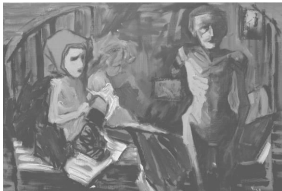
Йона Тукусер. Детский дом, 2010 (холст, масло, 90 x 120)

реальном фото) сигнализирует о том, что детей не обижают в приюте, однако этот человек явно покидает их, возможно, он уходит в иной мир.