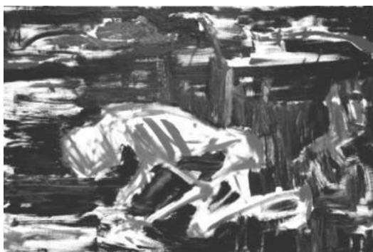
Йона Тукусер. Ищущий, 2010 (холст, масло, 90 x 130)

Несколько слов следует сказать об авторской технике. Художница намеренно угрубляет ее, а также использует элементы экспрессии, используя ядовитые яркие тона с целью усилить трагический аспект живописи. В одной из своих публикаций Йона констатирует: «Здесь мы не можем не заметить сложные цвета, крупные удары широкой кистью, пастозное наложение материала. Это следы физического действия в процессе создания живописи. В полотнах прокрадываются отчаянные крики, как будто стихия захватила человека – стихия труднообъяснимая, невидимая, без четких очертаний – это скорее цвет с ощущением боли. Это одно лицо голода, когда ты полностью сломлен, предал себя объятиям смерти, и не имеешь силы сделать шаг вперед. Это темные, уродливые, влачащиеся тела, здесь и не следует искать эстетику красоты» [3, с. 229].