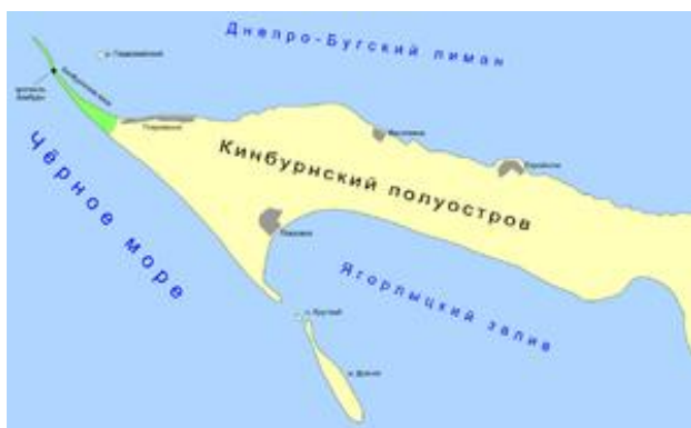
Кинбурнская коса («Бег Ахилла»), Николаевская область

Белый остров стал главным местом почитания героя в сравнении с культом на Березани, в Бейкушском поселении, в Большой Черноморке, на Кинбурнской косе. Указанные культовые места (за исключением Кинбурнской косы) были основаны в VI в. до н.э., и функционировали на протяжении одного или полутора столетий (к V в. до н.э. контроль над