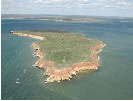
О. Березань, Очаковский район Николаевской области

При изучении сведений из различных источников, в которых содержатся упоминания о культе на Белом острове, любой исследователь сталкивается с одной из древнейших путаниц в его описании, связанной с существованием двух островов в Черном море, на которых ведущим был культ Ахилла: