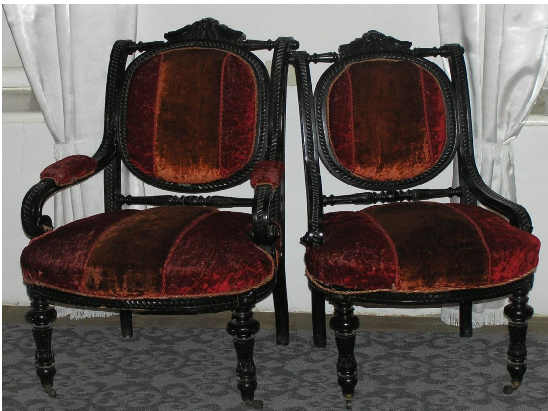
Рис. 3.1. Меблі родини Захаріаді м. Ізмаїл