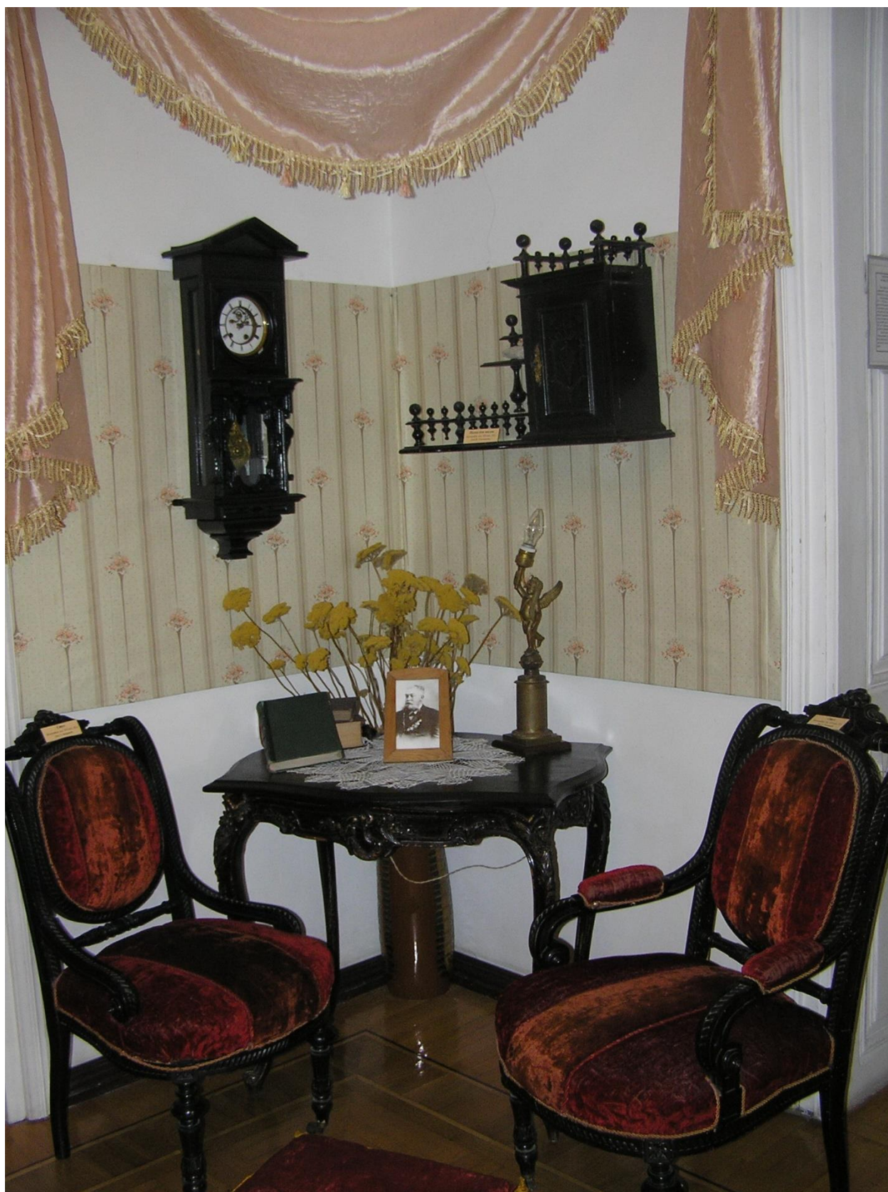
Рис. 3.3. Меблі родини Захаріаді м. Ізмаїл