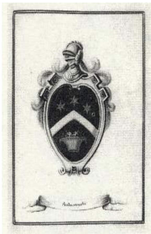
Рис. 3.6. Герб родини Родоканакі