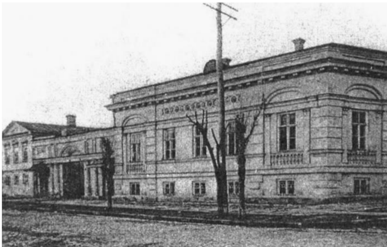
Рис. 3.10. Будинок родини Маврокордато. Одеса