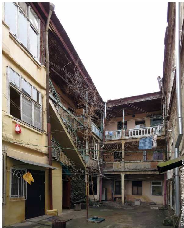
Рис. 3.7. Прибутковий будинок родини Родоканакі. Одеса