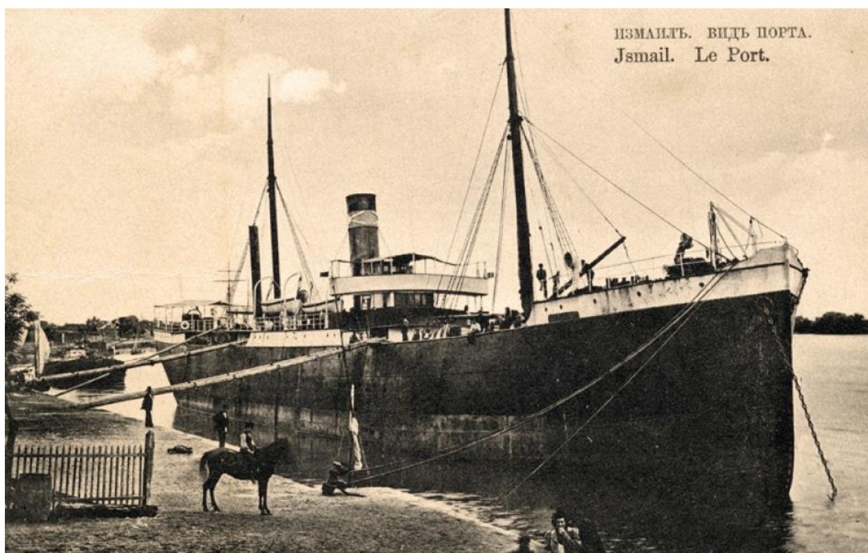
Рис. 3.4. Ізмаїльський порт (ілюстрація 1909 року) інтернет-ресурс