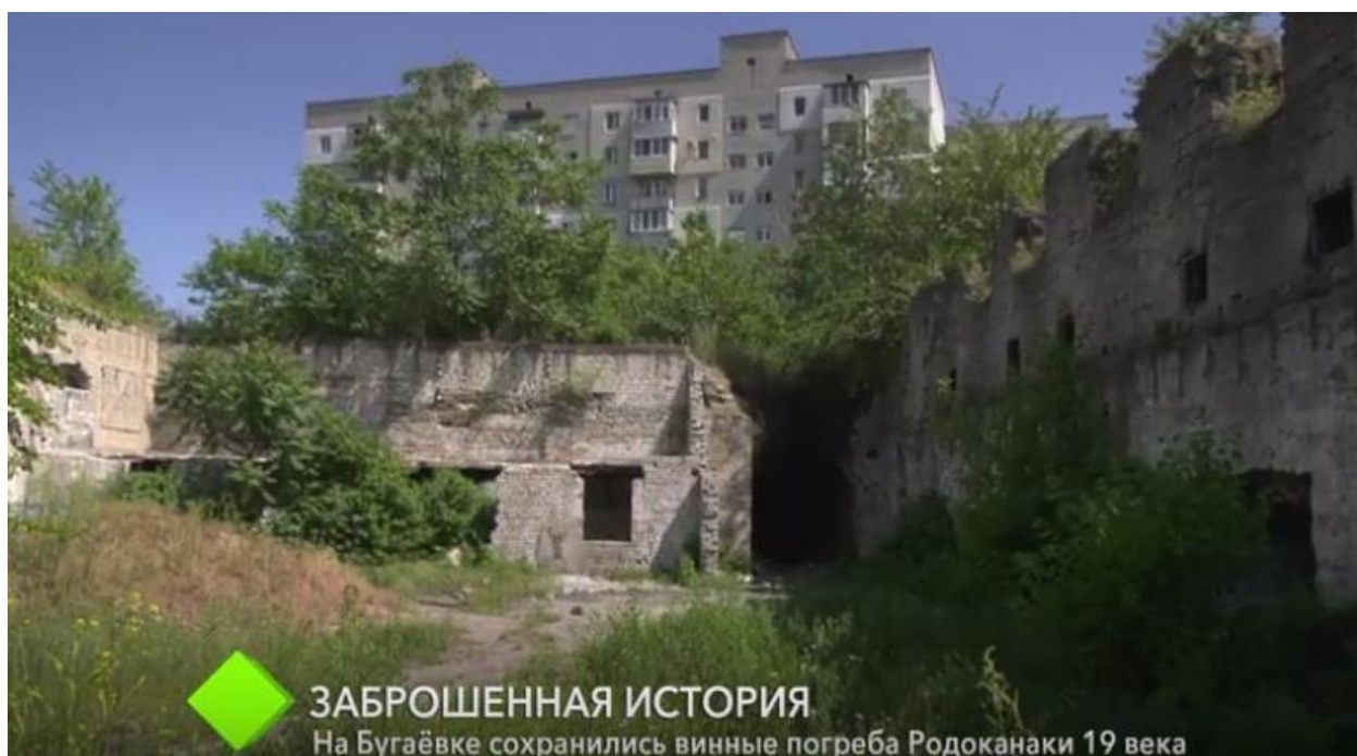
Рис. 3.8. Винний льох родини Родоканакі. Одеса