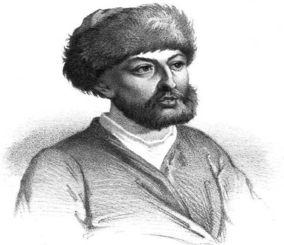
Рис. 3.9. О. Маврокордато